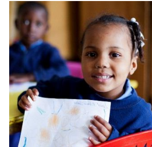
Ecolière Mission St-Luc