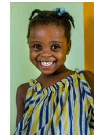
Enfant de Fond des Blancs